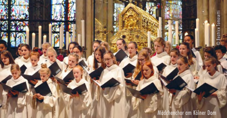
Mädchenchor am Kölner Dom