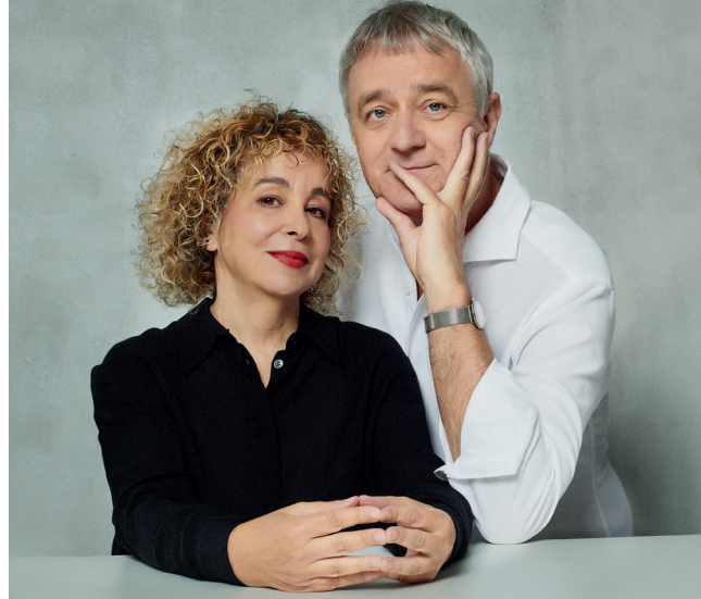
Klavierduo Tal-Groethuyseni

5. ABO KONZERT SO 23.05.27 · 16 UHR KÖLNER PHILHARMONIE