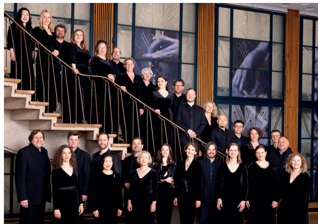
WDR Rundfunkchor

Das Kölner Kammerorchester spielt Franz Beyers respektvolle Überarbeitung, die vor allem für eine transparentere Instrumentation steht. Aus seiner Feder stammt auch die Bearbeitung für Streichorchester der Fantasien für Orgelwalze – die der Komponist als Kuriosum für ein Wachsfigurenkabinett schrieb.