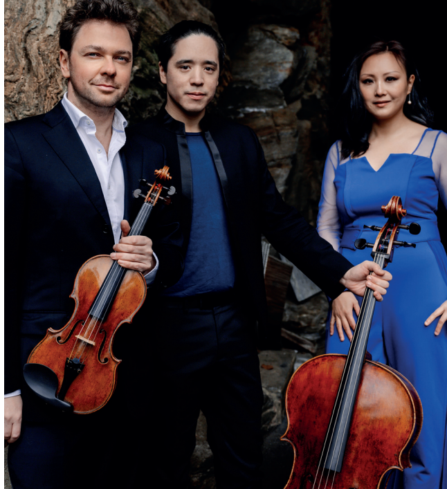
Sitkovetsky Trio

2. ABO KONZERT SO 15.11.26 · 11 UHR KÖLNER PHILHARMONIE